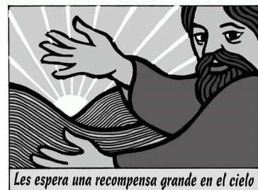
Les espera una recompensa grande en el cielo

Lectura del santo Evangelio según san Lucas. 6, 17. 20-26 En aquel tiempo, Jesús bajó del monte con los Doce, se paró en una llanura con un grupo grande de discípulos y una gran muchedumbre del pueblo, procedente de toda Judea, de Jerusalén y de la costa de Tiro y de Sidón. Él, Levantando los ojos hacia sus discípulos les decía: «Bienaventurados los pobres, porque vuestro es el Reino de Dios. Bienaventurados los que ahora tenéis hambre, porque quedaréis saciados. Bienaventurados los que ahora lloráis, porque reiréis. Bienaventurados vosotros cuando os odien los hombres, y os excluyan, y os insulten y proscriban vuestro nombre como infame, por causa del Hijo del hombre. Alegraos ese día y saltad de gozo, porque vuestra recompensa será grande en el cielo. Eso es lo que hacían vuestros padres con los profetas. Pero ¡ay de vosotros, los ricos, porque ya habéis recibido vuestro consuelo! ¡Ay de vosotros, los que estáis saciados, porque tendréis hambre! ¡Ay de los que ahora reís, porque haréis duelo y lloraréis! ¡Ay si todo el mundo habla bien de vosotros! Eso es lo que vuestros padres hacían con los falsos profetas». Palabra del Señor.