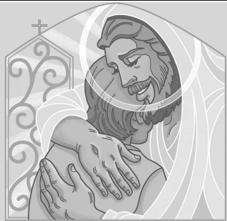
Grande será tu recompensa en el cielo