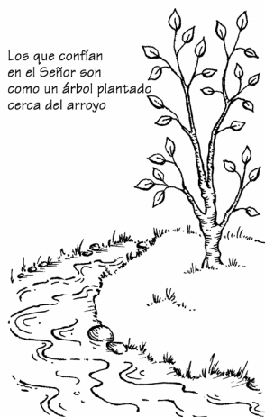
Los que confían en el Señor son como un árbol plantado cerca del arroyo

Hermanos: Si se anuncia que Cristo ha resucitado de entre los muertos, ¿cómo dicen algunos de entre vosotros que no hay resurrección de muertos? Pues si los muertos no resucitan, tampoco Cristo ha resucitado; y, vuestra fe no tiene sentido, seguís estando en vuestros pecados; de modo que incluso los que murieron en Cristo han perecido. Si hemos puesto nuestra esperanza en Cristo solo en esta vida, somos los