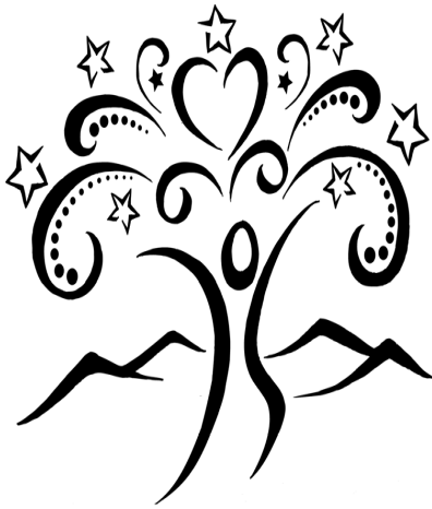
© J. S. Paluch Co., Inc.

—Fray Gilberto Cavazos-Glz, OFM, Copyright © J. S. Paluch Co.