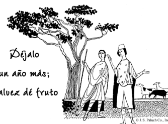
Déjalo un año más; tal vez dé fruto

Conviértanse porque ya está cerca el Reino de los cielos