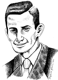
Beato Carlos Manuel Rodríguez Santiago