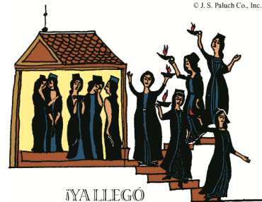
¡YA LLEGÓ EL NOVIO, SALGAN A RECIBIRLO!

En aquel tiempo, dijo Jesús a sus discípulos está parábola: «Se parecerá el reino de los cielos a diez doncellas que tomaron sus lámparas y salieron a esperar al esposo. Cinco de ellas eran necias y cinco eran sensatas. Las necias, al tomar las lámparas, se dejaron el aceite; en cambio, las sensatas se llevaron alcuizas de aceite con las lámparas. El esposo tardaba, les entró sueño a todas y se durmieron. A medianoche se oyó una voz: “¡Que llega el esposo, salid a recibirlo!” Entonces se despertaron todas aquellas doncellas y se pusieron a preparar sus lámparas. Y las necias dijeron a las sensatas: “Dadnos un poco de vuestro aceite, que se nos apagan las lámparas.” Pero las sensatas contestaron: “Por si acaso no hay bastante para vosotras y nosotras, mejor es que vayáis a la tienda y os lo compréis.” Mientras iban a comprarlo, llegó el esposo, y las que estaban preparadas entraron con él al banquete de bodas, y se cerró la puerta. Más tarde llegaron también las otras doncellas, diciendo: “Señor, señor, ábrenos.” Pero él respondió: “Os lo aseguro: no os conozco.” Por tanto, velad, porque no sabéis el día ni la hora. » Palabra del Señor.